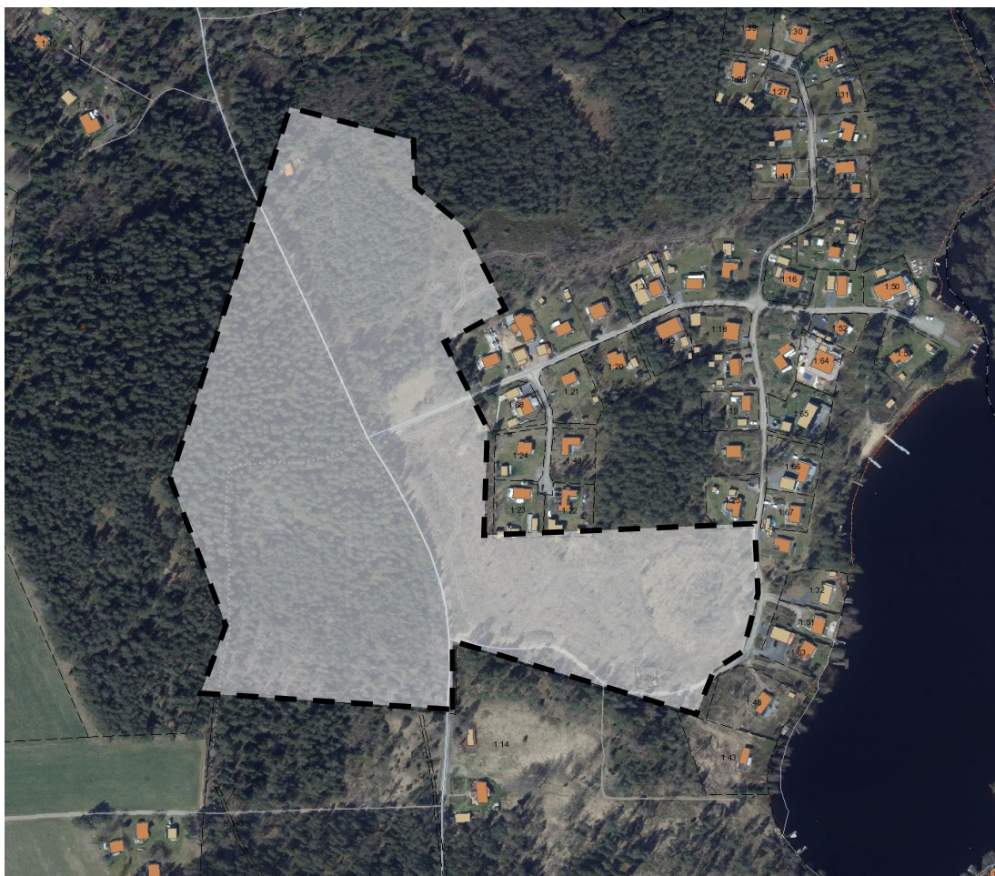
Ortofoto över planområdet

Inom ramen för detaljplanesområdet ska kommunen undersöka om genomförandet av detaljplanen kan antas medföra en betydande miljöpåverkan. Kommunen ska efter genomförd undersökning fatta ett särskilt beslut om genomförandet kan antas medföra betydande miljöpåverkan. Kan betydande miljöpåverkan antas ska en strategisk miljöbedömning göras, Miljöbalken (1988:808) 6 kap 3 §.